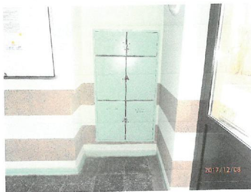
Zdj.nr 1.Widok na główna rozdzielnicę w budynku.

Zgodnie z § 183. ust.2 i 3. Rozporządzenia [3]. Przeciwpowarowy wyłącznik prądu, odcinający dopływ prądu do wszystkich obwodów, z wyjątkiem obwodów zasilających instalacje i urządzenia, których funkcjonowanie jest niezbędne podczas pożaru, należy stosować w strefach powarowych o kubaturze przekraczającej 1.000 m 3 lub zawierających strefy zagrożone wybuchem. Przeciwpowarowy wyłącznik prądu powinien być umieszczony w pobliżu głównego wejścia do obiektu lub złącza i odpowiednio oznakowany.