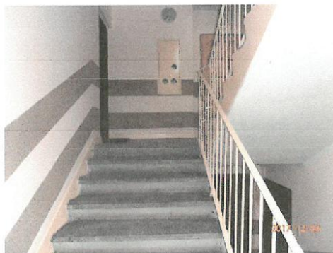
Zdj. nr 9.Widok na klatkę schodową budynek nr 80.