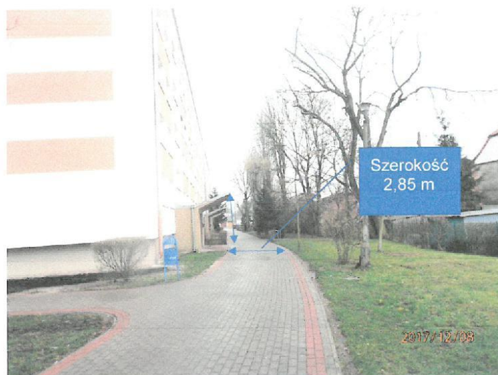
Zdj.nr 4 Widok na chodnik (drogę pożarową) od strony północnej obiektu.

Wzdłuż dłuższego boku od strony zachodniej przebiega chodnik z kostki betonowej z oświadczeń inwestora wynika, że został ułożony na podbudowie chodnika betonowego, szerokość chodnika wynosi 2,85 m do rzutu pionowego na teren poziomy krawędzi daszków przy wyjściach ewakuacyjnych (zdjęcie nr 1). Uwzględniając szerokość jak wyżej bliższa krawędź chodnika jest w odległości 2,85 m od ściany budynku.