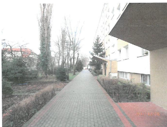
Zdj.nr 5. Widok na chodnik od strony południowej.

Wzdłuż dłuższego boku od strony zachodniej przebiega chodnik z kostki betonowej z oświadczeń inwestora wynika, że został ułożony na podbudowie chodnika betonowego, szerokość chodnika wynosi 2,85 m do rzutu pionowego na teren poziomy krawędzi daszków przy wyjściach ewakuacyjnych (zdjęcie nr 1). Uwzględniając szerokość jak wyżej bliższa krawędź chodnika jest w odległości 2,85 m od ściany budynku.