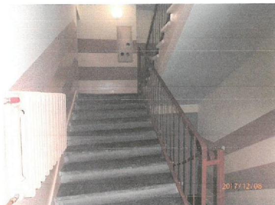
Zdjęcie nr 8 .Widok na klatkę schodową budynek nr 82.