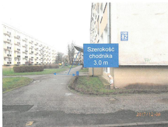
Zdjęcie nr 3. Widok na chodnik przy posesji nr 82 .

Budynek ZL IV (SW) przy ulicy Okrężnej 82 w Inowrocławiu.